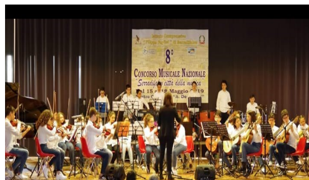
ORCHESTRA I. C. "M.L. KING"